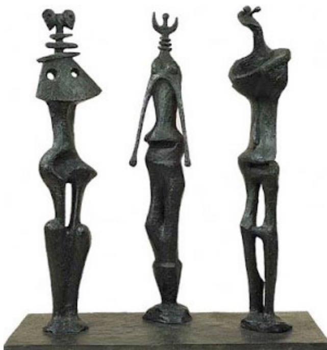
Obra de Julio González.

Análisis de discurso desde una perspectiva psicoanalítica.