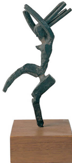
Julio González, "Pequeña bailarina", 1929-1930.

Introducción a los conceptos freudianos y a la clínica psicoanalítica.