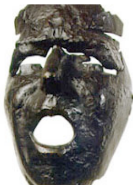
Julio González. "Máscara de Montserrat gritando" (1936).

Freud señaló las dos vertientes del síntoma, al destacar su dimensión de mensaje y su dimensión de goce, en el sentido en que no se goza más que del fantasma. Este es el fundamento de recuperar para la clínica contemporánea la singularidad del sujeto en la estructura frente a los protocolos que uniforman al sujeto y olvidan la importancia del concepto freudiano de repetición.