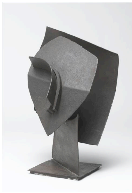
Julio González, "Cabeza en profundidad", 1930.

De los cuatro discursos a las fórmulas de la sexuación.