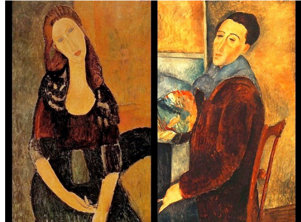
Retrato de Jeanne Hebuterne sentada y autorretrato Amedeo Modigliani

Las referencias artísticas son abundantes en el seminario 6 de J. Lacan. Y sus planteamientos sobre la sublimación, exhaustivos. Pero es precisamente a Ofelia, a quien sitúa como el barómetro del deseo en las siete clases dedicadas a Hamlet. Considera la tragedia fundada en la relación del sujeto con la verdad. En cambio, la comedia está más allá del pudor y es un curioso atrapadeseos. No hay otro malestar en la cultura que el malestar del deseo, afirma J. Lacan, pues lo que en la sociedad se presenta como cultura instauro en ella una dialéctica que deja abierta la misma brecha que aquella en cuyo interior situamos la función del deseo. Si la ciencia rechaza la subjetividad, ¿por dónde retorna? Evidentemente, por el arte. La pintura, la literatura, el cine, son pruebas de ello. ¿Y cómo retorna en la política? En las contradicciones de los personajes que han destacado en la historia. Lo personal viene a hacer síntoma, inevitablemente. Estudiaremos a Shakespeare, a Einstein, a Hitler, a Stalin, pero también a Genet y Gide. El tema no está cerrado por supuesto, sólo balbuceamos su apertura.