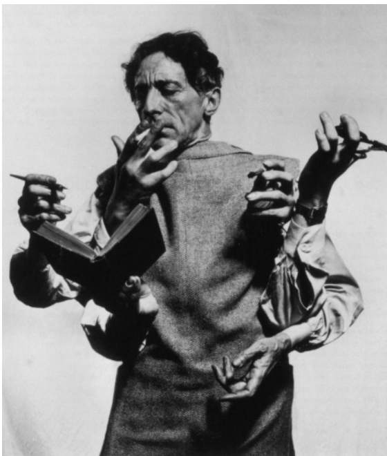
Jean Cocteau - Man Ray

El psicoanálisis y su relación con el saber en las relaciones didácticas.