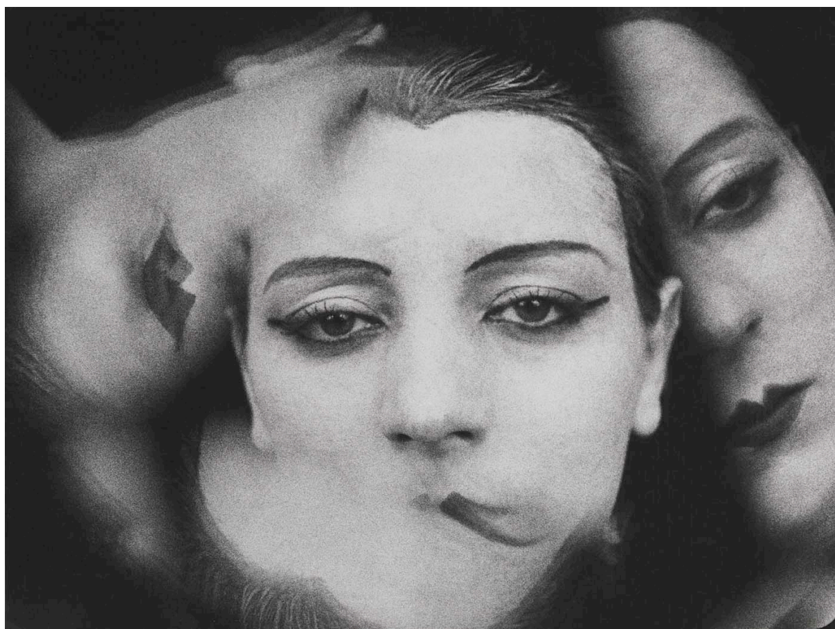
Man Ray- Kiki de Monparnase

Introducción a los conceptos freudianos y a la clínica psicoanalítica.