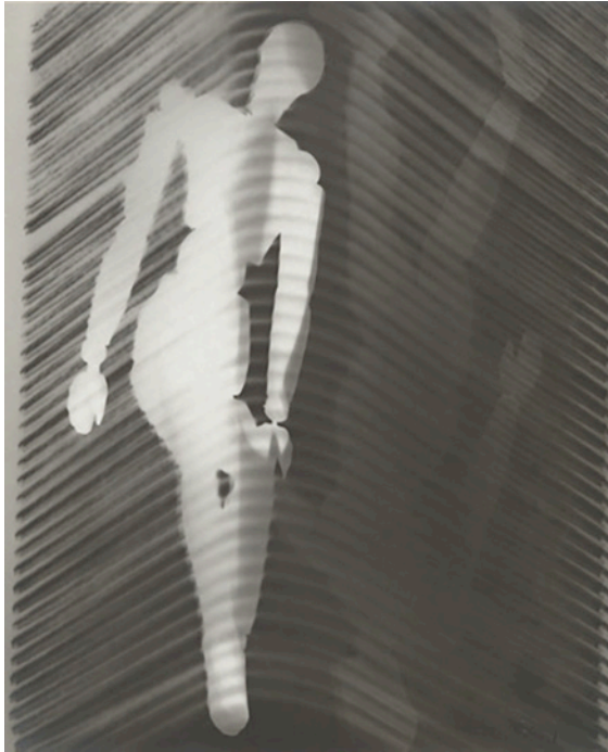
Manikins and Grate (1923–24) - Man Ray

Análisis de discurso desde una perspectiva psicoanalítica.