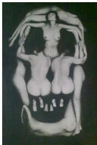
Salvador Dalí - En Voluptas Mors

Fluctuaciones del deseo en las estructuras clínicas.