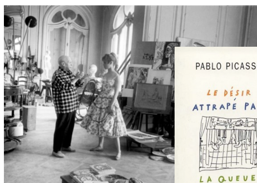
Pablo Picasso El deseo atrapado por la cola

Este curso 2016/2017, siguiendo la lógica del estudio de las referencias del Seminario, durante 18 clases de los miércoles, nos aproximaremos a ellas.