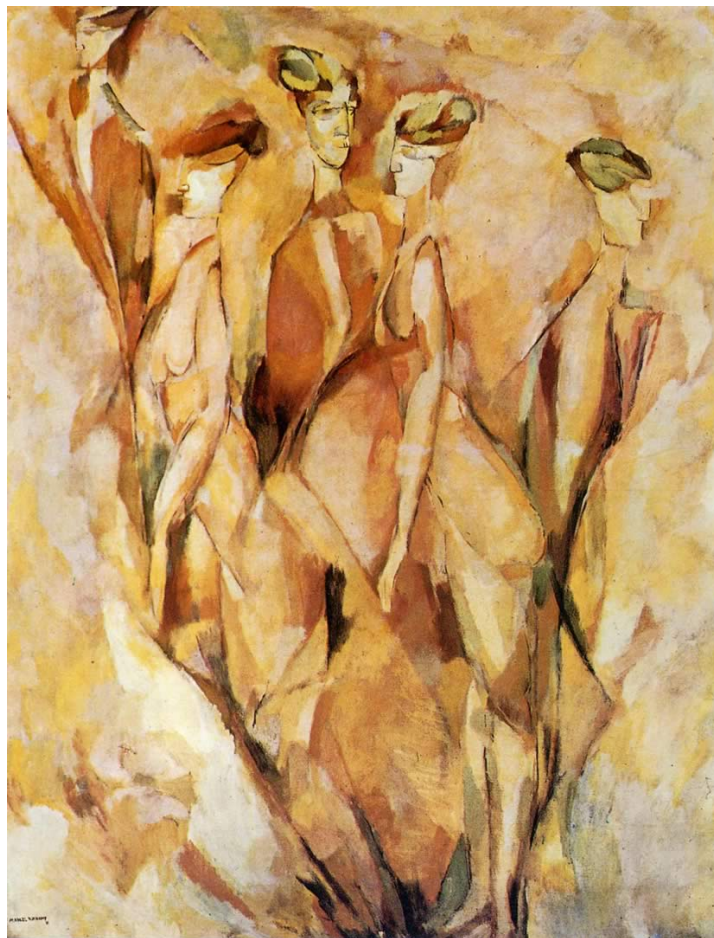
Retrato de Dulcinea, Marcel Duchamp.

XVIII aniversario del Col.legi de Clínica Psicoanalítica de València XVIII Aniversario del Centro Psicoanalítico de Atención Clínica de Valencia (CPAC-FCCL)