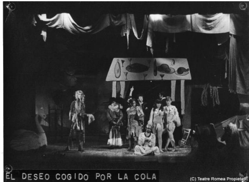
Pablo Picasso - El deseo cogido por la cola

Análisis de discurso desde una perspectiva psicoanalítica.