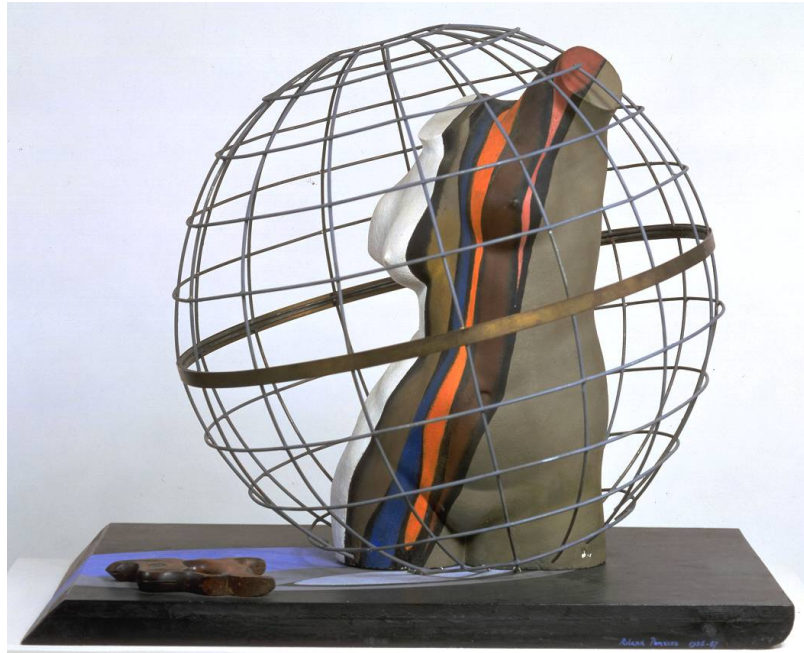
Roland Penrose - The last voyage of captain Cook

Introducción a los conceptos freudianos y a la clínica psicoanalítica.