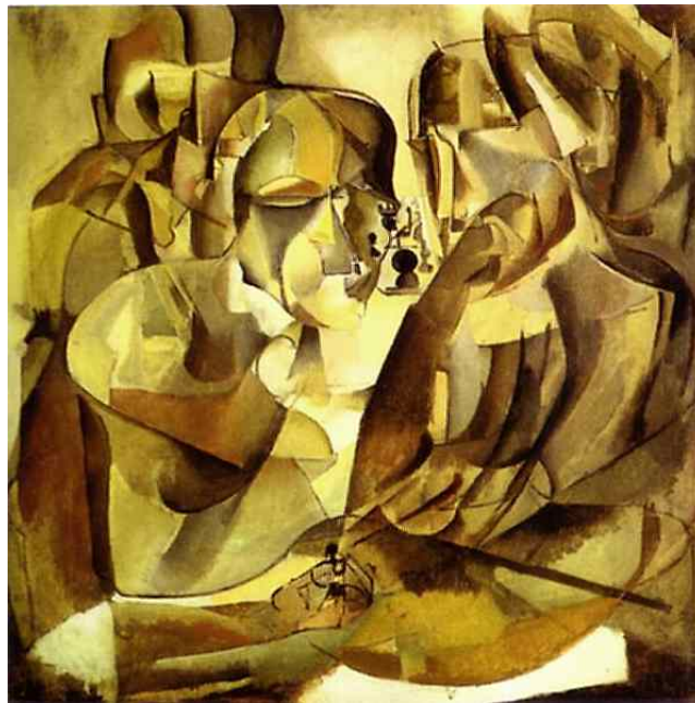
Retrato de jugadores de ajedrez. Marcel Duchamp