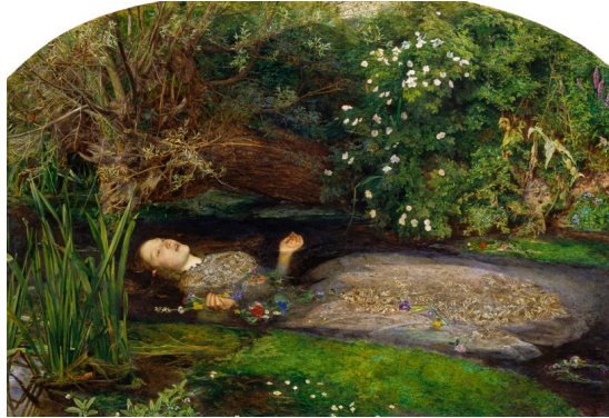
John Everett Millais - Ophelia

Las referencias artísticas son abundantes en el seminario 6 de J. Lacan. Y sus planteamientos sobre la sublimación, exhaustivos. Pero es precisamente a Ofelia, a quien considera el barómetro del deseo en las siete clases dedicadas a Hamlet.