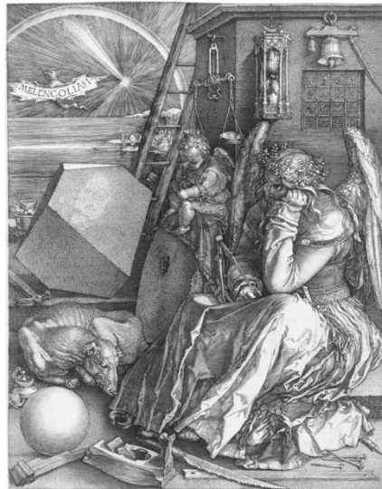
Dürer - Melancholia I

Lo propio de los atolladeros en los que se enreda el ser hablante es ser fecundos. En ellos se adentra el enigma del deseo que en psicoanálisis es interrogado a partir de las relaciones del sujeto con su objeto. De ahí parte lo que constituye el síntoma. Y sólo pueden captarse en el anudamiento entre lo Imaginario, lo Simbólico y lo Real.